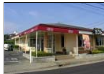
ゲスト店内でも告知ツールを展開