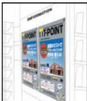
TSUTAYA店頭でポスター等を掲示