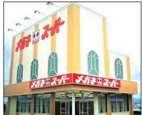
ティーポイントの認知