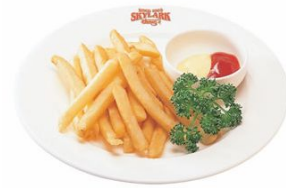
「すかいらーく」の店頭で告知展開