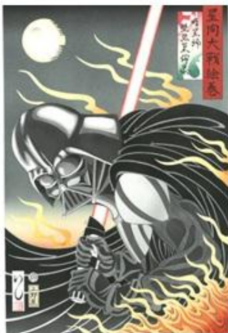
「星間大戦絵巻 暗黒卿 堕悪巢俣奈」