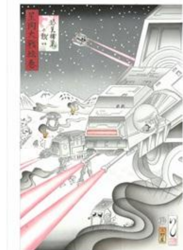
「星間大戦絵巻 惑星補巢の戦い」