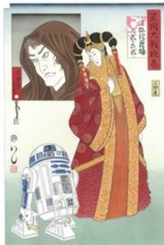
「星間大戦絵巻 阿弥陀羅姫 R式D式」