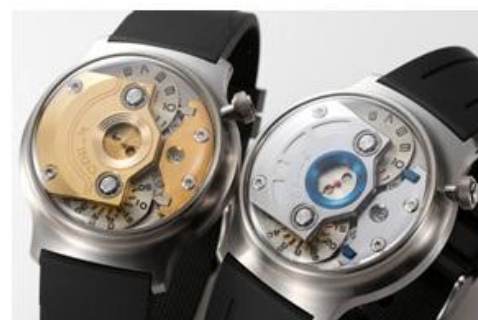
「STAR WARS Inspired Watch」 ¥198,000

※イベントの速報などはこちらのHPもご参照ください ⇒ http://tsutaya.jp/sw7dt/