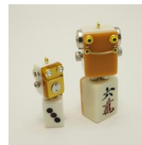
オリジナル商品 麻雀ロボ

「東京ゲームショウ」は、長年数多くのゲームファンを魅了し続けているイベントです。C・Eは、その趣旨に賛同し、昨年より同イベントにおいてTカードがチケットになるサービス「Tチケット」の販売を行なっておりましたが、今年はTチケット販売に加えて、ブース出展が決定しました。ブース内では、「東京ゲームショウ 2017」のメインビジュアルを使用したオリジナルデザインのTカードの発行や、同イベントのために用意した麻雀ロボなどオリジナルグッズも販売いたします。