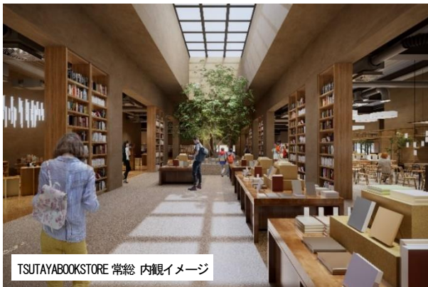
TSUTAYABOOKSTORE 常総 内観イメージ

カジュアルにクリエイティブなライフスタイルを提案する「BOOK & CAFE」（CCCが企画、東和観光開発が運営）