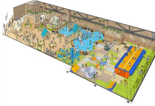
子どもの遊び場 kusuguru イメージパース