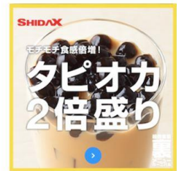
レストランカラオケ シダックス