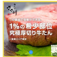
牛たん ささ川（関東エリア限定）