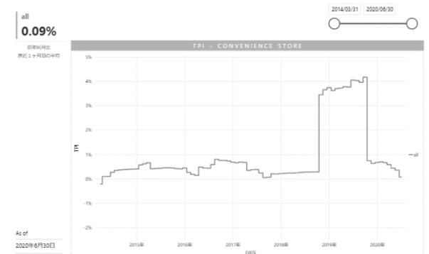
▲TPI:コンビニエンスストア