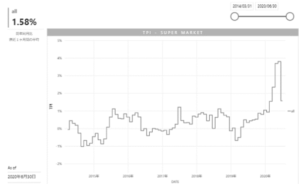
▲TPI:スーパーマーケット