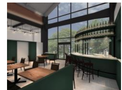
designed by mangekyo

自然光が差し込む、大きな窓。景色と連なる、やわらかなグリーンが心地よい店内。ランチタイムからカフェ、ディナーまで、さまざまなシーンでゆったりと過ごせる空間です。彩り豊かで鮮やかな、フレンチテイストのリゾットをメインとしたお料理と、ナチュラルワインの数々を心ゆくまでお楽しみください。