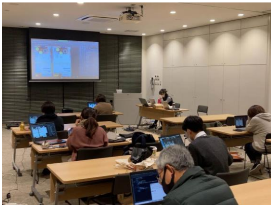
(オンラインでのライブ授業の様子)

■ ライブ授業・・・東京にいる講師と Zoom で繋ぐことでオンラインのライブ授業もスムーズに実施できました。基本的に毎回の授業は「提出課題の講評」、「Web デザインに関わる知識・テクニック講義」、「オフィスアワー」で構成。受講生は自宅からでも図書館からでも授業への参加が可能で、質問等があれば Zoom のチャット機能などを利用してリアルタイムで疑問を解消していきました。