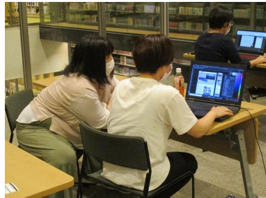
(オフィスアワーの様子)

■ 修了式・・・講座の最後の締めとして修了式を実施しました。半年間の成果として制作した Web ページについて一人一人が高梁市役所方や吉備ケーブルテレビの取材撮影のスタッフに向けて、企画と目的から成果物まで 5 分間で発表。修了課題には市内企業をクライアントとして選ばれた方もおり、ヒアリングから設計まで多くの受講生が経験できました。