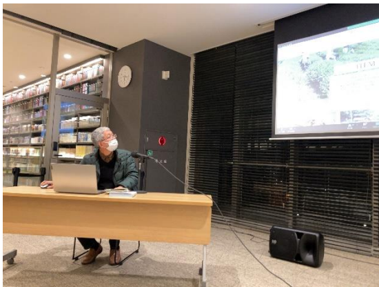
(修了課題の発表の様子)

■ 修了式・・・講座の最後の締めとして修了式を実施しました。半年間の成果として制作した Web ページについて一人一人が高梁市役所方や吉備ケーブルテレビの取材撮影のスタッフに向けて、企画と目的から成果物まで 5 分間で発表。修了課題には市内企業をクライアントとして選ばれた方もおり、ヒアリングから設計まで多くの受講生が経験できました。