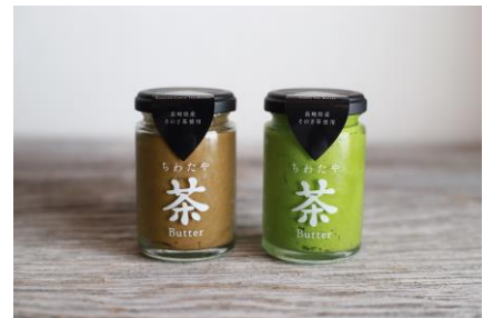
<ちわたや茶バター>

「武雄温泉駅観光案内所」は、入口の暖簾をくぐると、江戸時代中期、領主・武雄鍋島氏の専用風呂として造られた総大理石の見事な風呂「武雄温泉 殿様湯」の市松模様を継承したデザインの内装に、風呂桶などを活用して商品を並べるなど、温泉の街である武雄市の窓口として、観光客の皆様をお迎えいたします。