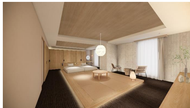
Modern Japanese-style Room (コネクティングルーム)

「JAPAN」をコンセプトにした客室は 1 タイプご用意しています。茶室のエッセンスを取り入れた和室と洋室の快適性を兼ね備えた和モダンなインテリアで、日本文化と伝統をより身近に感じられるホテルステイを提供します。