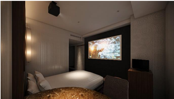
Box Theater Room (シングル・ダブルルーム)

「ゲーム」を楽しめる客室は、人気の PC ゲームを存分に楽しめるスペックの機材をご用意。ゲーミングモニター、チェア、ヘッドフォン、さらにはライティングにもこだわり、臨場感のある演出の中、人目を気にせずゲーム体験に集中できてテンションが上がる、大人のためのゲーミングルームです。