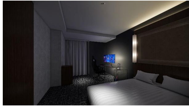
Trial Gaming Room (モデレートダブルルーム)