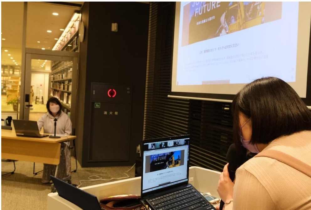
(修了発表会での講師フィードバック)