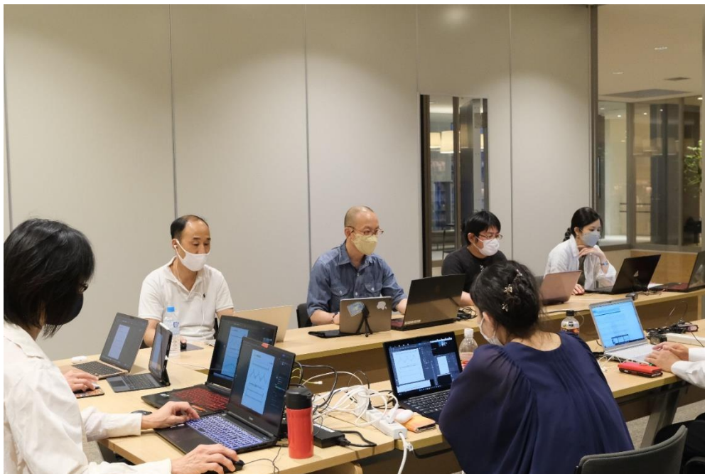
(図書館に集まり Zoom でライブ授業を受講)

kurufuwa https://nrms-1977.sakura.ne.jp/