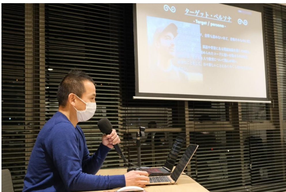
(修了発表会での受講生発表)