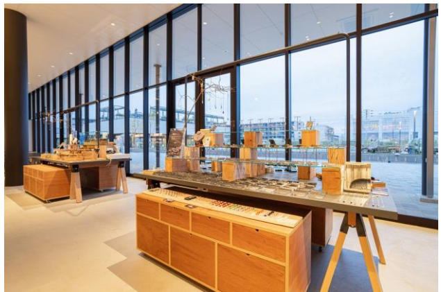
<様々な商品を展開する POP UP スペース>