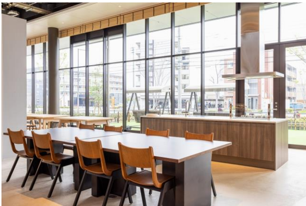
<「食」に関するイベントを実施するキッチンエリア>

食に関する体験ができる大きなキッチン、ものづくり体験スペース、お子さま向けのイベント等を開催するキッズスペースや、限定品や地域特産品を展開する POPUP スペースなどを通じて、まちの方々が主役となるイベントを実施します。地域の交流を生む、コミュニティ拠点となることで、まちの未来の発展を地域と共に実現する書店を目指します。