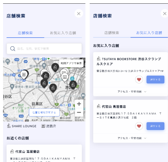
<店舗検索> <お気に入り店舗登録>

今後も快適に「SHARE LOUNGE」をご利用いただけるよう、アプリをはじめとする各種サービスを拡充してまいります。