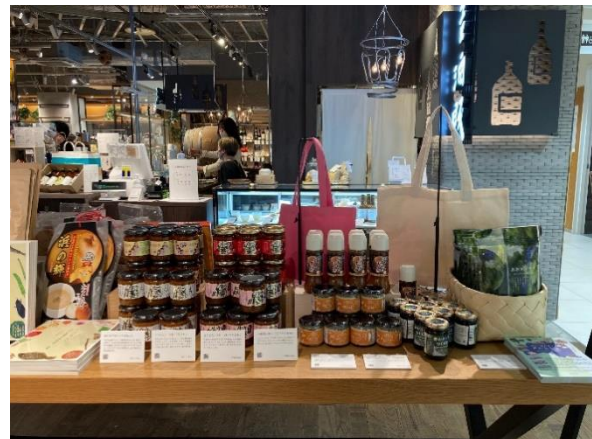
<「六本松 蔦屋書店」（福岡県）でのPOP UPショップ実施例>