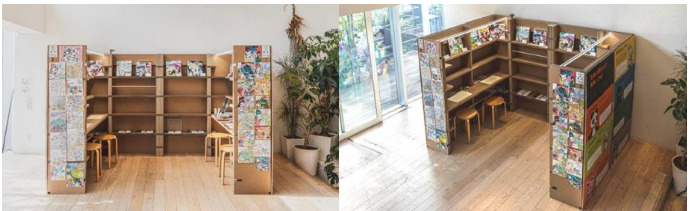
【活用事例】カレンダーやグッズ等の企画・製造・販売を行う株式会社ハゴロモと、NFT 発の IP「CryptoNinja Partners」を展開する株式会社バケットによる物販・ファンイベント利用

両社は、カウンターワークスが保有するポップアップストア運営のノウハウや出店場所と、CCCが提供する「BlockyJOYPOP」、企画提案力やデータ分析等を用いることで、ポップアップストア事業の拡大と価値向上に向けて取り組んでいきます。まずは TSUTAYA・蔦屋書店を含む都内近郊エリアにて『BlockyJOYPOP』の提供を開始いたします。