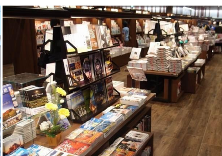
マガジストリート