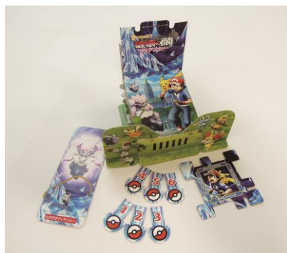
☆キッズおたのしみブックふろく①