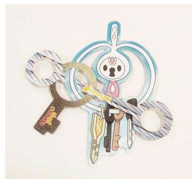
☆キッズおたのしみブックふろく②

【ポケモン映画公式サイト http://www.pokemon-movie.jp 】