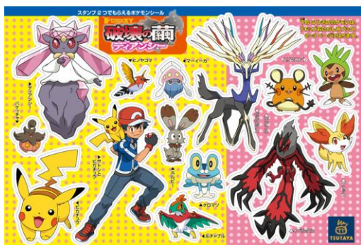
☆スタンプ2つでシールをゲット！

キッズスタンプカードにスタンプを2つ集めると「ポケモンシール」が、3つ集めると、ぬりえやふろくなどがいっぱい「キッズおたのしみブック」がもらえます！