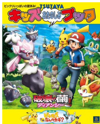
☆スタンプ3つでキッズおたのしみブックをゲット！