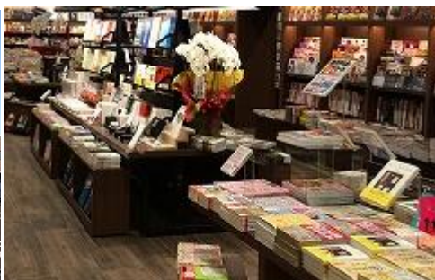
マガジストリート