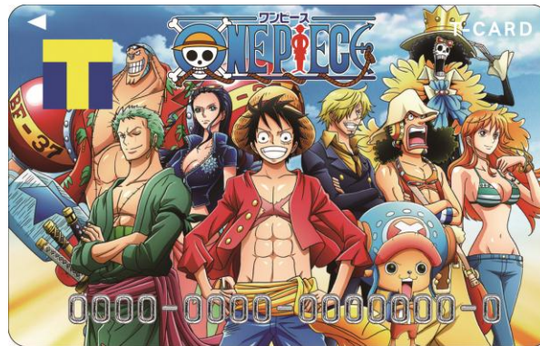
「ワンピース×Tカード」