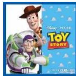
★シール2枚目(全15種内1種類)