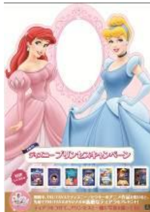
☆プリンセススタンディ