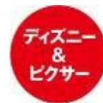
キャンペーン対象商品シール

URL: http://tsutaya.tsite.jp/feature/movie/campaign/2015summer/disney-rental