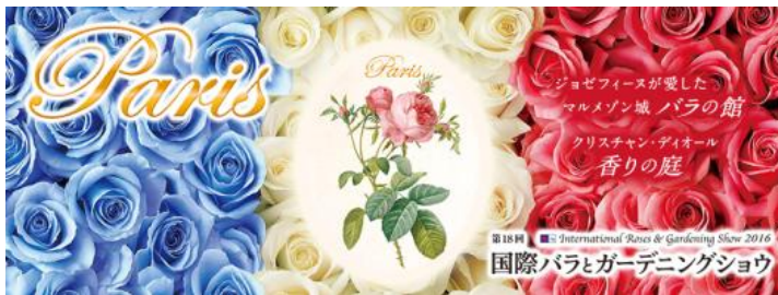
(中央の植物画) ビエール＝ジョゼフ・ルドゥーテ【バラ図譜より】 <ロサ・ケンティフォリア・フォリアケア>コノサーズ・コレクション東京所蔵 画像はイメージです。実際の色味とは異なります。