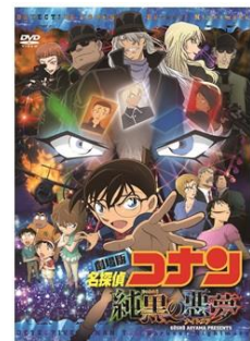
レンタルDVD 『名探偵コナン 純黒の悪夢』 ©2016 青山剛昌／名探偵コナン製作委員会

また、12月までに毎月リリースされる新作アニメ作品5作品のうち3作品を借りると、抽選で豪華賞品が当たるプレゼントキャンペーンも開始いたします。10月26日から同作品のブルーレイ・DVDを購入されたお客様には、先着でクリアファイルをプレゼントいたします。