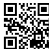
<Android 用 QR コード>