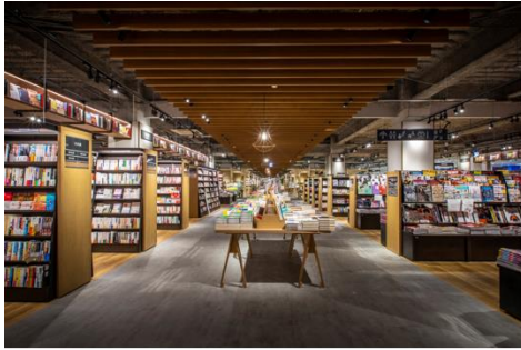
TSUTAYA BOOKSTOREホームズ新山下店