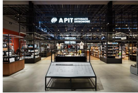
TSUTAYA BOOKSTORE APIT東雲店