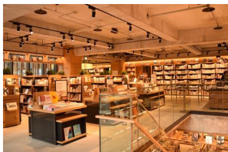
3 階 BOOK

3階では、キッズ、生活美容、食、旅行、文芸・人芸など豊富な書籍を取り揃えています。また、屋外には開放感あふれるテラス席も完備しています。