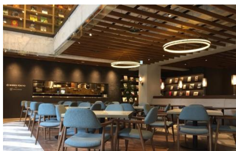
2 階 「WIRED TOKYO」

2階に展開する 100 席を有する「WIRED TOKYO」では、「ダグズ・バーガー」が海外初出店。