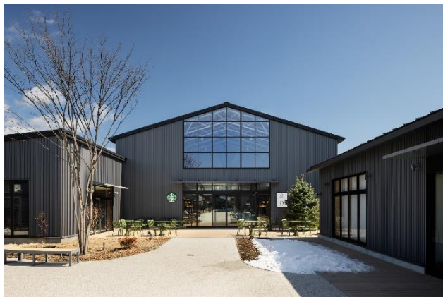
▲ 軽井沢 T-SITE の外観