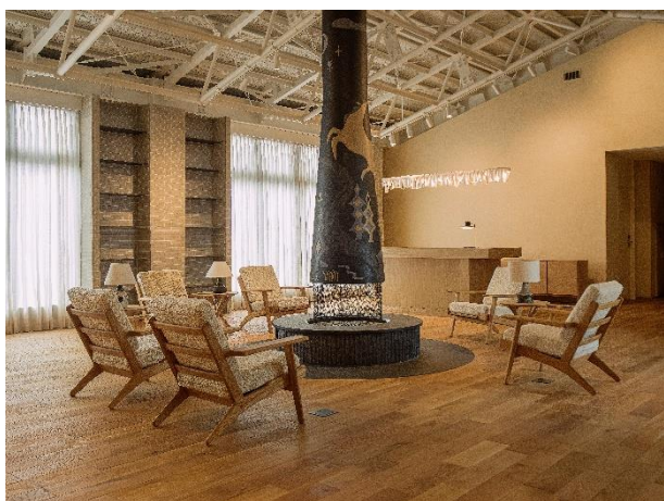
▲ HACIENDA KARUIZAWA (ホテル) のエントランス