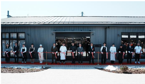
▲オープニングセレモニー

本施設はしなの鉄道株式会社が所有する敷地に位置し、1997年の北陸新幹線開業に伴い廃線となった旧信越本線の線路跡地を活用して整備したものです。本敷地を三菱地所が借地し、軽井沢駅自由通路直結の商業施設を開発、アクアイグニスおよびカルチュア・コンビニエンス・クラブが温浴施設や宿泊施設、飲食・物販店舗等の運営を担います。3社は「軽井沢 T-SITE」を通じて地域社会との連携を深め、軽井沢、さらには信州全体の魅力発信・活性化に貢献してまいります。