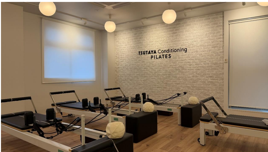
TSUTAYA Conditioning PILATES 覚王山店： https://tc.tsite.jp/pilates/4258