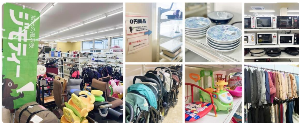
ジモティースポットの様子（写真は他店舗の様子）