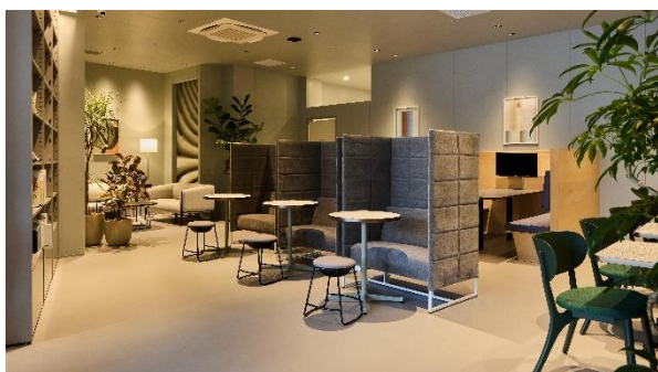
<様々な席種が全 108 席>