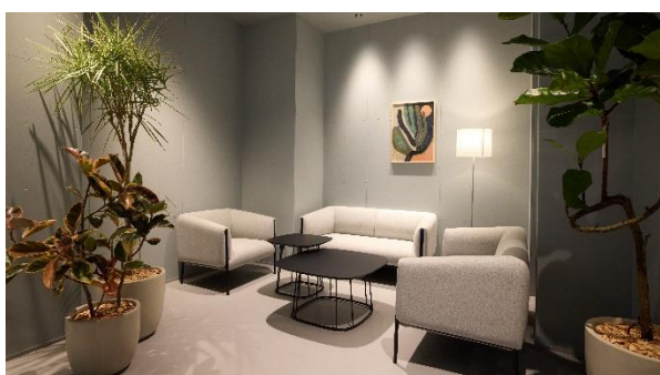
<地域の方々との交流も楽しめるカフェ席>