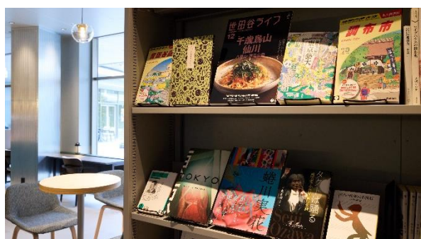
<仙川エリアの魅力を感じられる書籍>