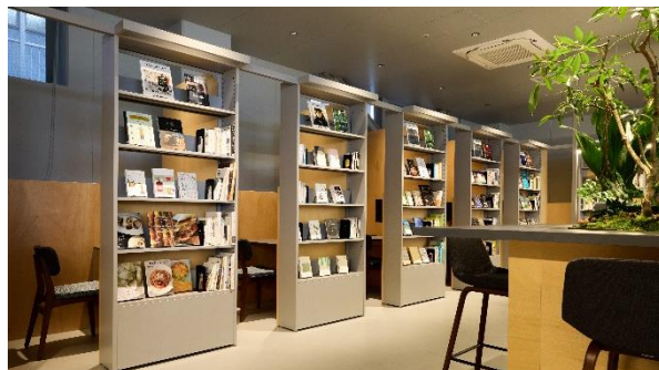
<集中してワークに取り組める個人ブース>